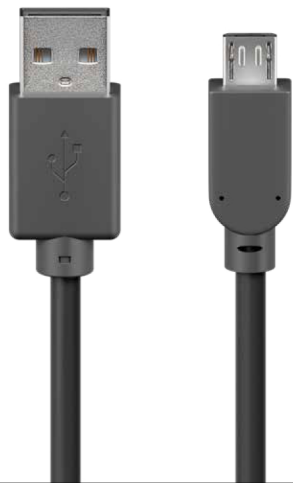
USB A/M Micro USB 5PIN Male